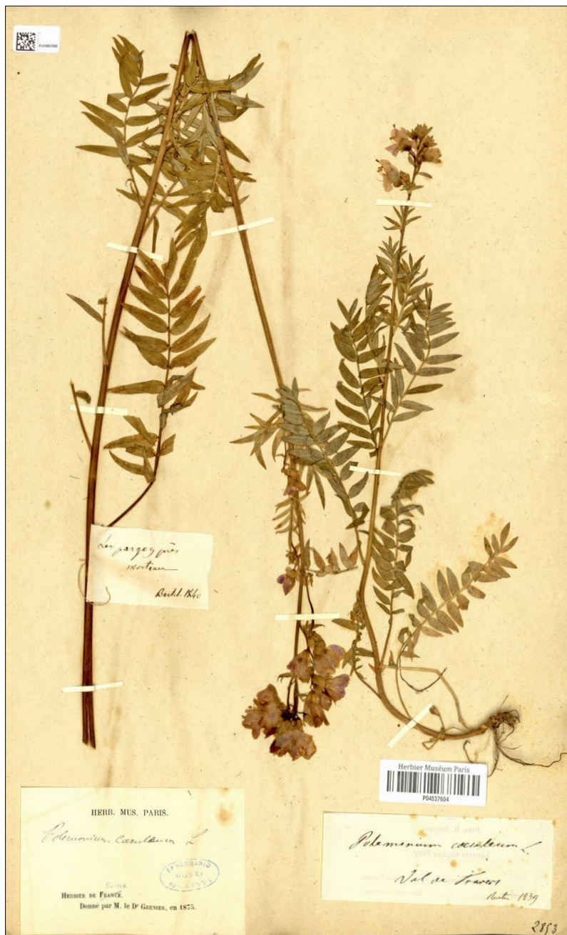
Figure 8 : herbier général du Muséum de Paris, herbier de Charles Grenier.

En 2000, Jean-François Prost 25 indique la polémoine bleue comme rare pour le département du Jura. Elle est néanmoins présente sur les communes des Rousses, de Saint-Pierre en Grandvaux, de l'Abbaye, de Longchaumois, Foncine-le-Haut, Bois d'Amont et Grande-Rivière. Les premières observations pour ce département datent de 1978