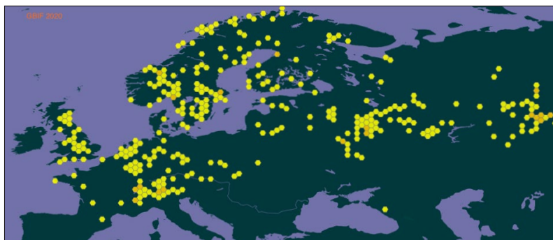
Figure 1 : répartition de P. caeruleum sur le continent eurasiatique.