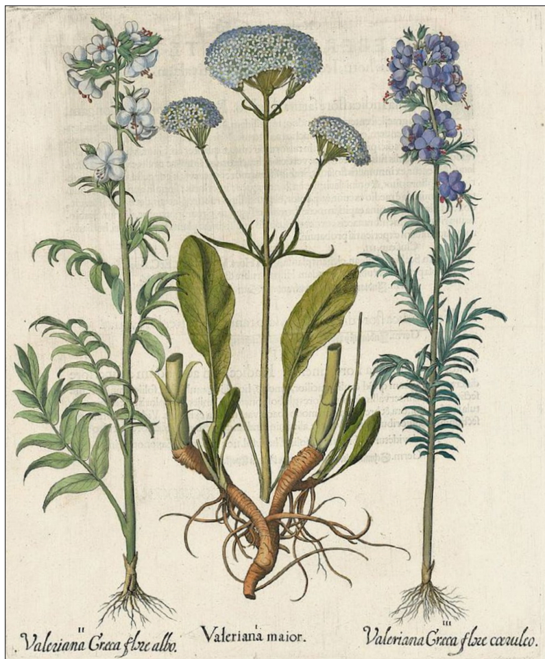
Figure 7 : P. caeruleum , gravure sur cuivre, planche coloriée extraite de l' Hortus Eystettensis (1613).

créé à Blois en 1636, la plante est mentionnée sous Valeriana graeca flore albo horti et Valeriana graeca flore coerulea horti ;