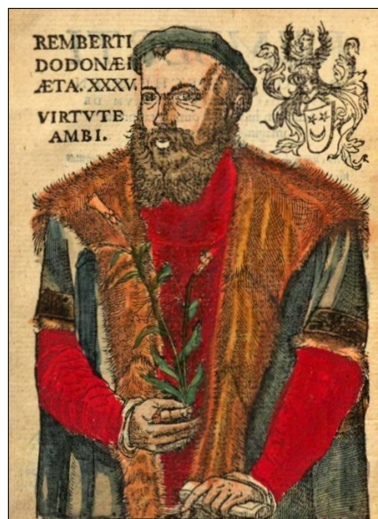
Figure 4 : portrait de Rembert Dodoëns, gravure sur bois coloriée.

porte une illustration très réaliste (figure 5). Une représentation un peu différente se trouve dans son célèbre Cruydeboeck , dont la première édition est parue en 1554 (en flamand), mais qui comporte au moins 13 versions dont des versions latines ( Stirpium historia Pemptades ), anglaises ( A New Herball de William Turner ou New Herball traduite par Lyte) et une version française traduite par Charles De L'Écluse en 1557, Histoire des Plantes . La dernière version correspond à la 4 e édition du Cruydeboeck , publiée en 1644 ; dans les dernières versions, les ajouts éventuels ont été apportés