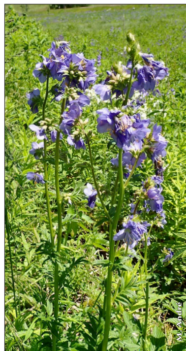
Figure 9 : P. caeruleum , vallée de la Morte.

Pour le massif des Pyrénées, c'est Picot de Lapeyrouse (1744-1818) qui indique pour la première fois la plante dans son Histoire abrégée des plantes des Pyrénées de 1813 : point rare à la montagne de Cagire, au pic de Gard à las Stringouleres.