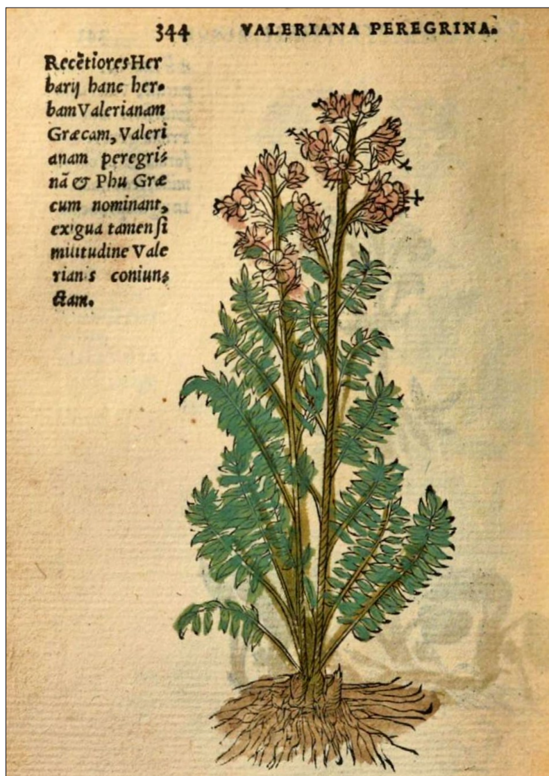
Figure 5 : P. caeruleum , gravure sur bois coloriée, extraite du Trium Priorum De Stirpium historia... , (1553).

porte une illustration très réaliste (figure 5). Une représentation un peu différente se trouve dans son célèbre Cruydeboeck , dont la première édition est parue en 1554 (en flamand), mais qui comporte au moins 13 versions dont des versions latines ( Stirpium historia Pemptades ), anglaises ( A New Herball de William Turner ou New Herball traduite par Lyte) et une version française traduite par Charles De L'Écluse en 1557, Histoire des Plantes . La dernière version correspond à la 4 e édition du Cruydeboeck , publiée en 1644 ; dans les dernières versions, les ajouts éventuels ont été apportés