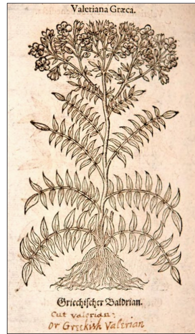
Figure 6 : P. caeruleum , gravure sur bois, extraite de Eicones Plantarum seu stirpium (1590).

À partir de la Renaissance, la plante est visiblement recherchée pour intégrer tous les jardins royaux et ceux des institutions scientifiques de l'époque :