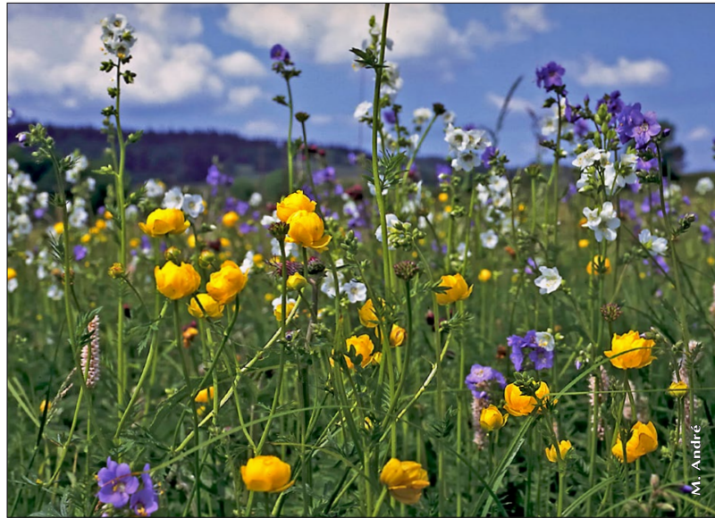
Figure 2 : groupement du Filipendulion ulmariae , Vaux-et-Chantegrue (25).