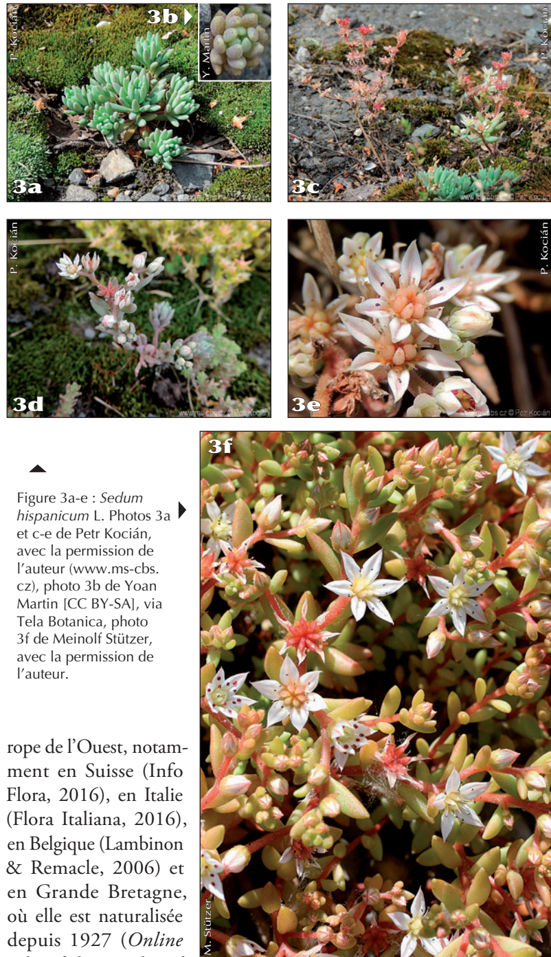
Figure 3a-e : Sedum hispanicum L.

Sedum hispanicum est une espèce indigène du sud-est de l'Europe et du sud-ouest de l'Asie, depuis les Alpes et l'Italie jusqu'à l'Iran et au Caucase (Lambinon & Remacle, 2006). Elle est maintenant recensée dans de nombreux pays de l'Eu-