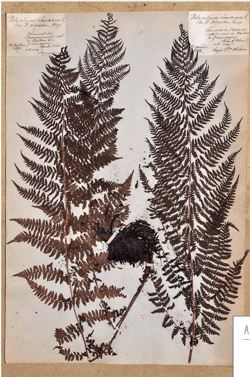
◀ Athyrium distentifolium , hercier Bonnamyé. Coll. muséum Cuvier, ville de Montbéliard. Propriété Société Belfortaine d'Émulation.