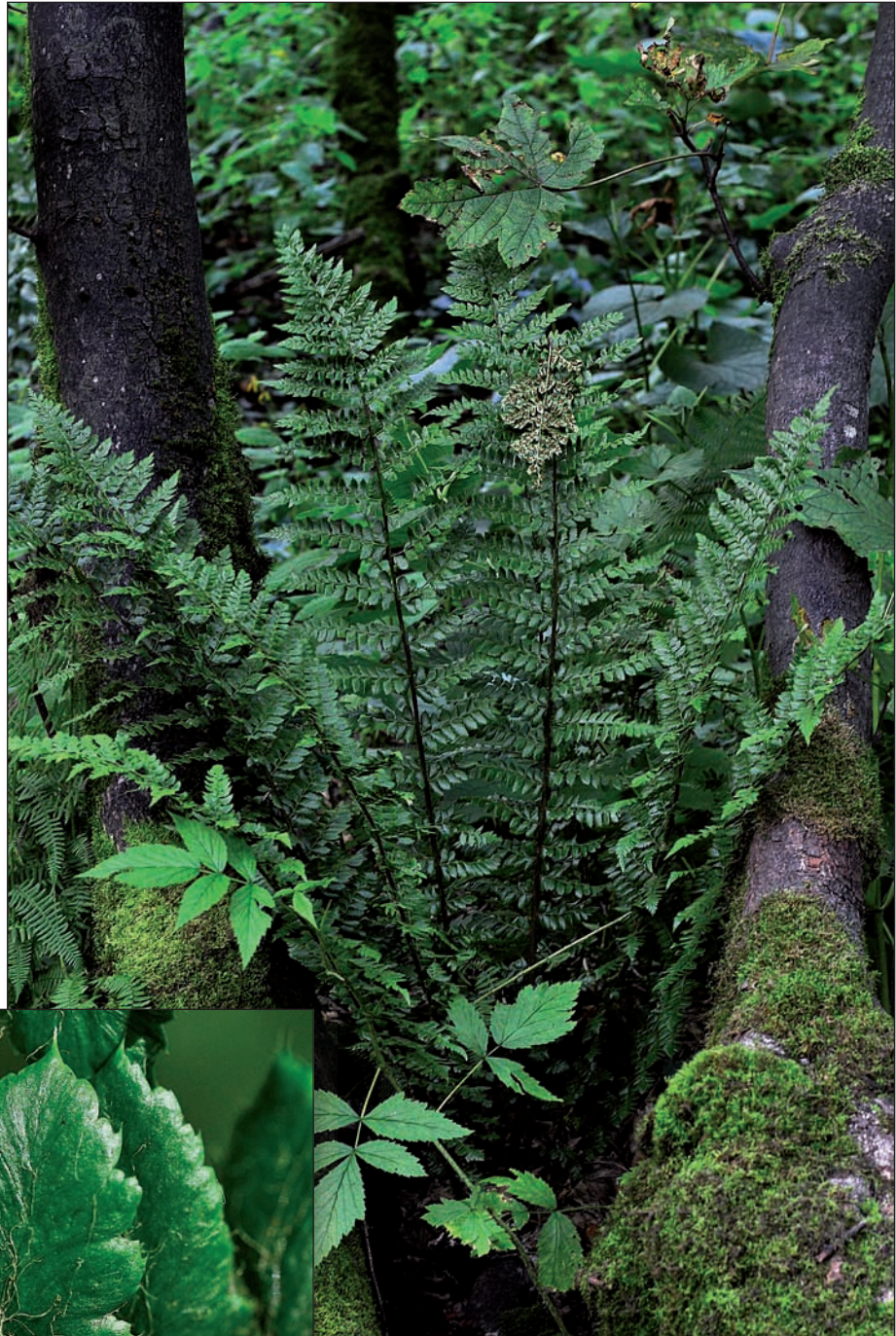
Polystichum braunii , habitus. ▶