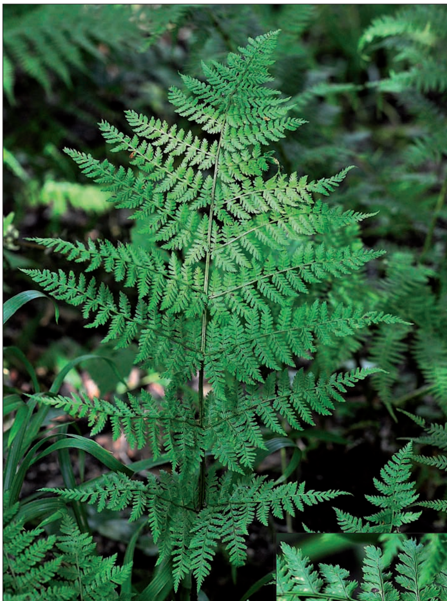
◀ Dryopteris expansa , aperçu d'une fronde.