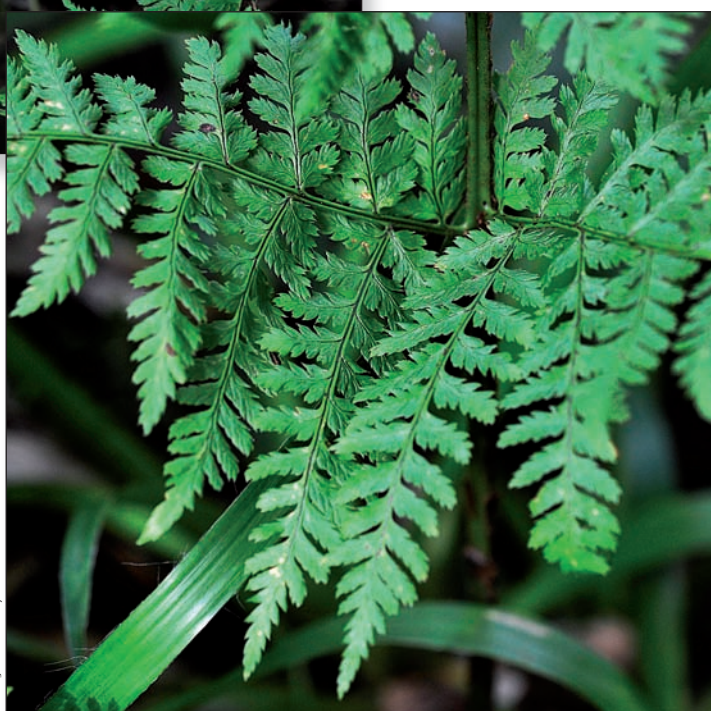
Dryopteris expansa , ▶ détail des pennes basales.