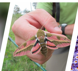
Sphinx de l'euphorbe ( Hyles euphorbiae ) (P. Jacquot)