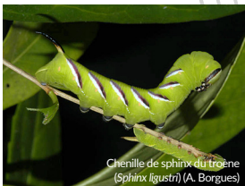
Chenille de sphinx du trône ( Sphinx ligustri ) (A. Borgues)