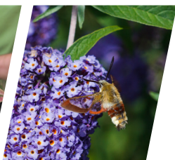
Sphinx gazé ( Hemaris fuciformis )