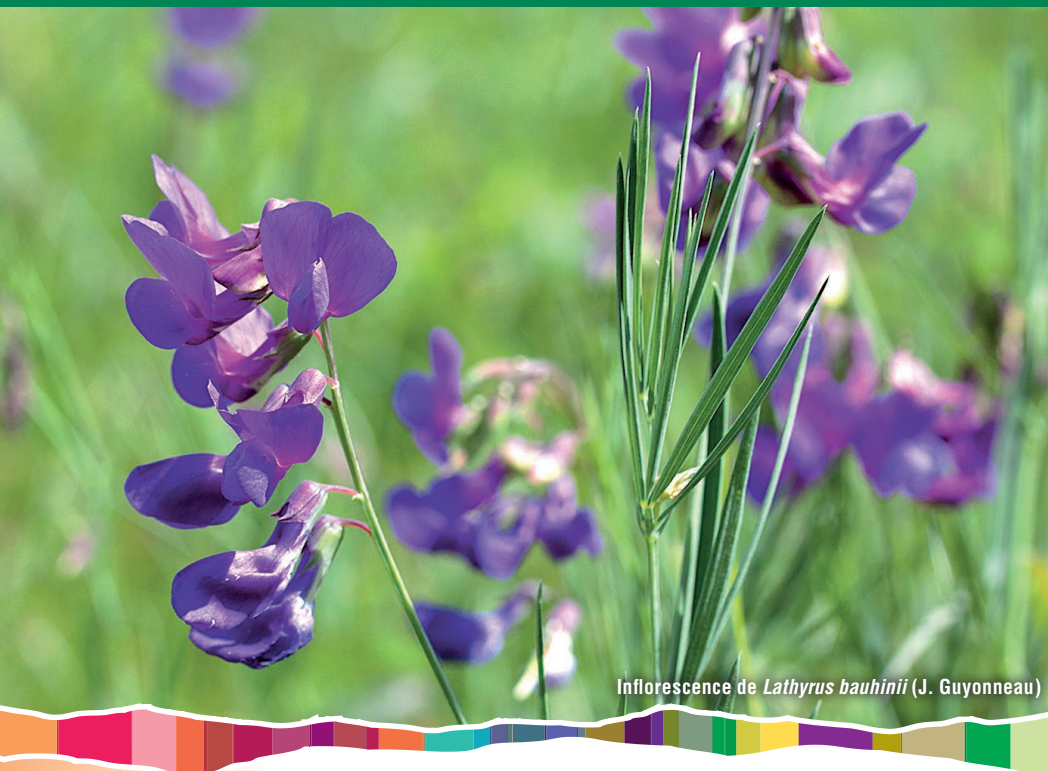
Inflorescence de Lathyrus bauhinii (J. Guyonneau)