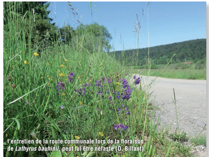
L'entretien de la route communale lors de la floraison de Lathyrus bauhinii , peut lui être néfaste (O. Billant)