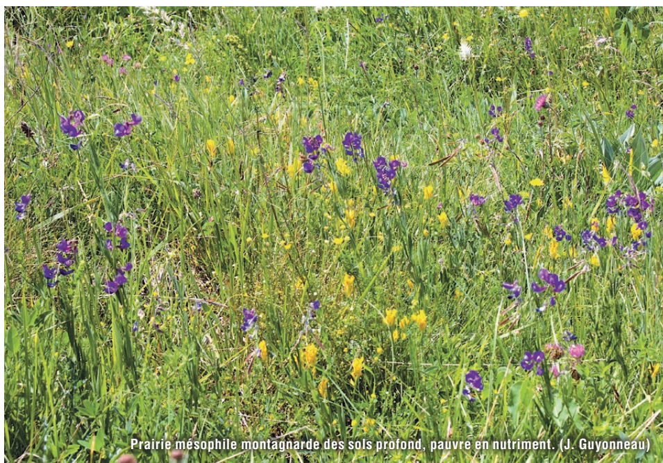
Prairie mésophile montagnarde des sols profonds, pauvres en nutriment. (J. Guyonneau)

La gesse de Bauhin est un taxon européen méridional présent en Espagne, en France, en Suisse, en Allemagne et à l'ouest de la péninsule des Balkans (Albanie, ex-Yougoslavie).