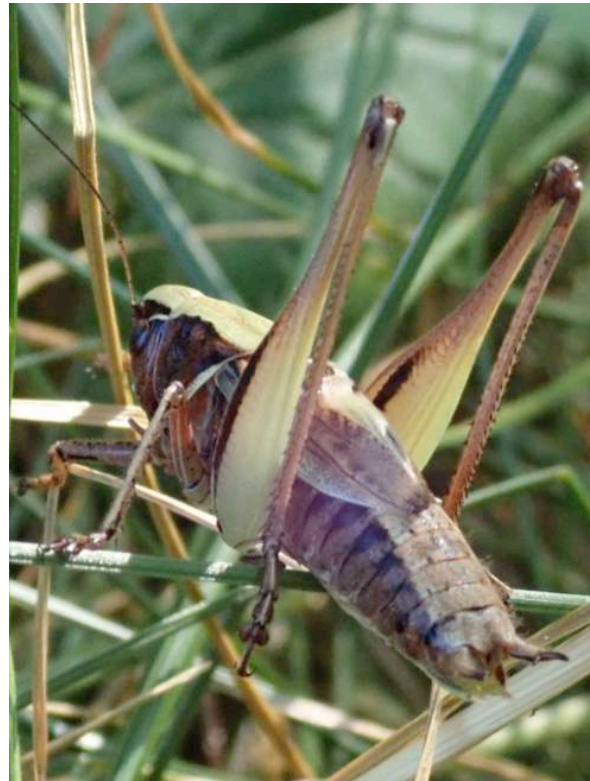
Figure n°4 - Decticelle des bruyères ( Metrioptera brachyptera ) observée sur le transect 1.

On notera enfin que la question des prospections au détecteur à ultrasons est ici à écarter, car si cette méthode offre des atouts indéniables en matière de détection de certaines espèces discrètes ou à activité nocturne, elle ne répond que partiellement à des objectifs de suivi. Son intérêt est avant tout basé sur l'acquisition de données permettant de compléter efficacement les listes faunistiques.