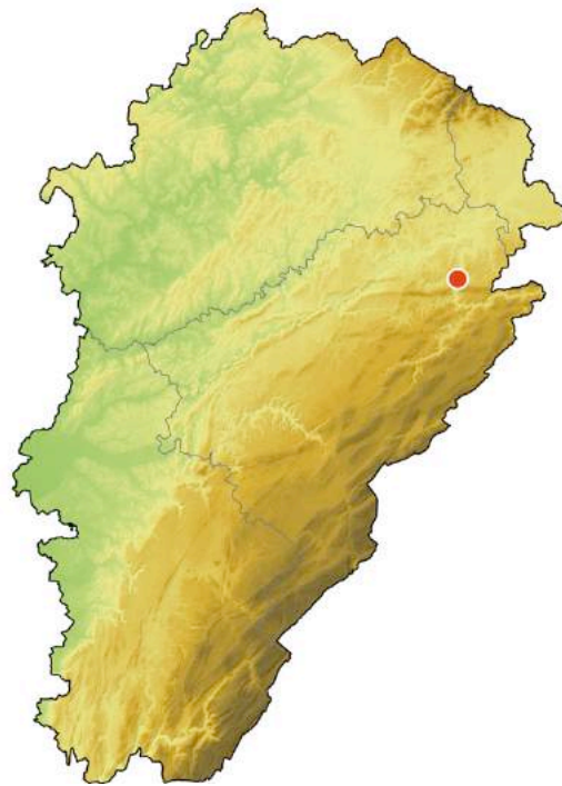
Figure n°1 - Localisation de la RNR du Crêt des Roches en Franche-Comté.

En complément, les autres espèces d'invertébrés (orthoptères compris) observées en dehors des transects lors des visites de terrain ont été consignées (Annexe 2).