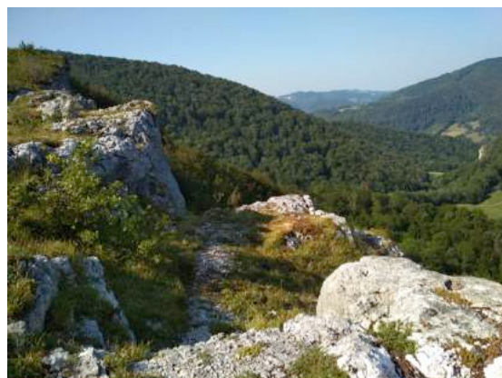
Figure n°2 - Milieu ouvert des corniches de la RNR.