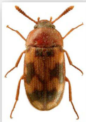
Figure n°11 - Mycetophagus piceus (Fabricius, 1777).

* Commentaires : capturé en 8 exemplaires des stations n° 1, 2, 4, 5 & 6.