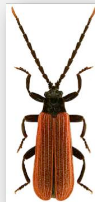
Figure n°9 - Platycis minutus (Fabricius, 1787).

* Commentaires : un exemplaire dans la station n° 6.