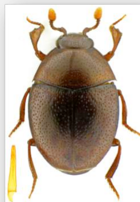
Figure n°17 - Abraeus roubali Olexa, 1958.

Son futur indice national Ip devrait s'élever à 4 du fait de son extrême rareté actuelle.