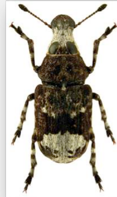
Figure n°4 - Tropideres albirostris (Schaller, 1783).

* Commentaires : un exemplaire dans la station n° 2.