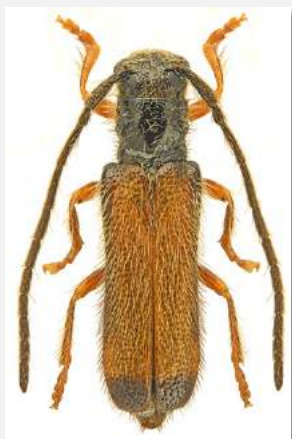
Figure n°16 - Tetrops starkii Chevrolat, 1859.

La position systématique exacte de ce taxon a été clarifiée récemment, et il est désormais élevé au rang d'espèce distincte de Tetrops praeustus . Sa répartition nationale reste à préciser (Tronquet M. et al. , 2014), mais il est assez largement répandu, selon une tendance similaire à la situation régionale. Son futur indice national Ip devrait s'élever à 3.