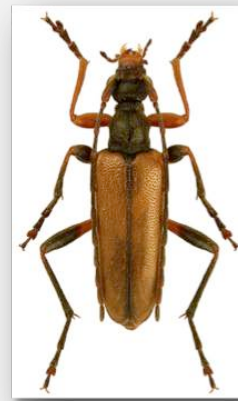
Figure n°15 - Pidonia lurida (Fabricius, 1792).

Assez répandu en Franche-Comté, surtout à partir des Premiers Plateaux, ce Cerambycidae est bien plus localisé en France où il occupe surtout les massifs montagneux (Tronquet M. et al. , 2014). Il a été capturé dans les stations 1 & 5 en cinq exemplaires, mais de nombreux individus ont été observés sur diverses inflorescences le long des chemins forestiers. Son futur indice national Ip devrait s'élever à 3.