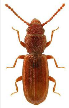
Figure n°18 - Cryptolestes corticinus (Erichson, 1846).

Un exemplaire de ce petit détritiphage supposé a été capturé dans la station n° 4. Assez largement distribué en France, il reste toutefois plutôt rare et son futur indice national Ip devrait s'élever à 3.