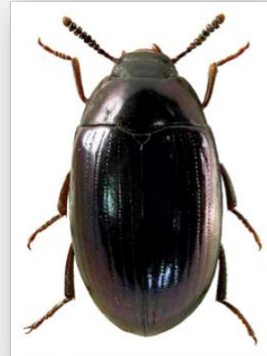
Figure n°12 - Platydema violacea (Fabricius, 1790).

* Commentaires : un exemplaire dans la station n° 5.