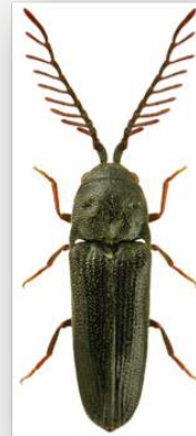
Figure n°8 - Microhagus lepidus Rosenhauer, 1847.

* Commentaires : 8 exemplaire des stations n° 1,4 & 5.