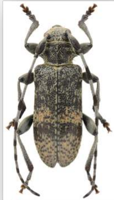
Figure n°6 - Oplosia cinerea (Mulsant, 1839).

* Commentaires : un exemplaire dans la parcelle n° 6.