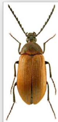
Figure n°13 - Pseudocistela ceramboides (Linnaeus, 1758).

* Commentaires : un exemplaire dans la station n° 5.