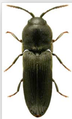
Figure n°7 - Dromaeolus barnabita (A. Villa & J.B. Villa, 1838). Source illustration : http://www.colpolon.biol.uni.wroc.pl

* Commentaires : 9 exemplaires des stations n° 2, 4 & 5.