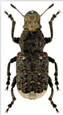
Figure n°3 - Platyrhinus resinusus (Scopoli, 1763).

* Commentaires : un exemplaire dans la station n° 5.