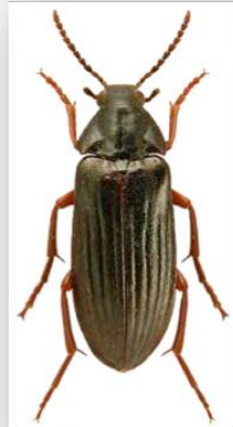
Figure n°10 - Melandrya barbata (Fabricius, 1792).

* Commentaires : un exemplaire dans la station n° 6.