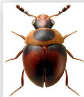
Figure n°19 - Liodopria serricornis (Gyllenhal, 1813).

Deux exemplaires de ce Nitidulidae mycophage ont été piégés dans la station n° 6. Ses larves se développent a priori dans la carie rouge très décomposée où elles consomment les filaments mycéliens. « Rare et localisé en moyenne montagne et dans les grandes forêts du centre et du nord » (Dodelin B., 2014), son futur indice national Ip devrait s'élever à 3 en raison de cette rareté apparente.