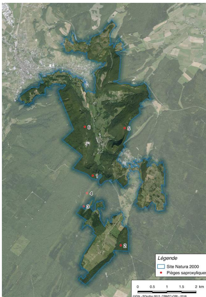
Figure n°1 - Carte localisation des placettes de piégeage.

les pièges n'aient été souvent déplacés que de quelques mètres.