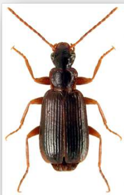
Figure n°14 - Dromius quadraticollis Morawitz, 1862.

Dans la future version nationale, ce carabique devrait se voir attribuer un Ip de 3.