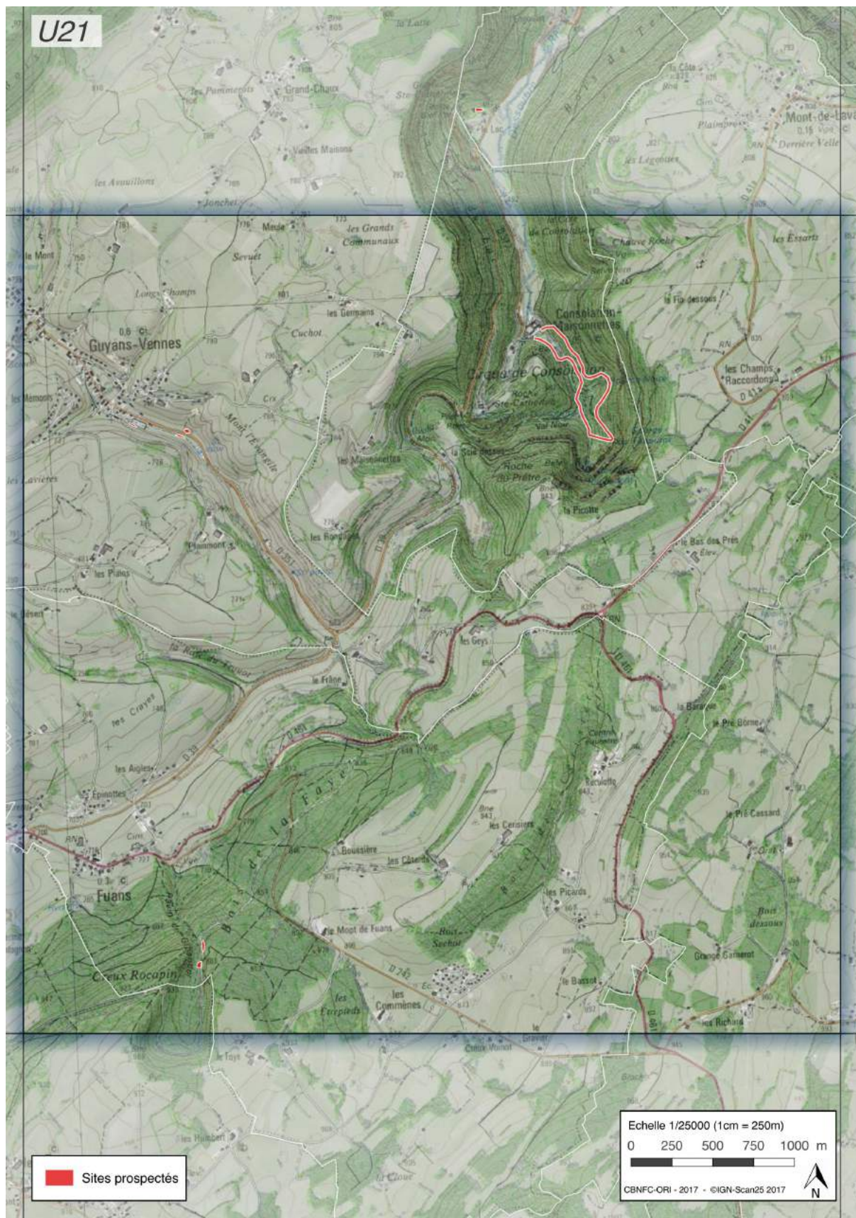
Figure n°7 - Maille U21.