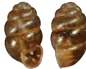
Vertigo des Alpes ( Vertigo alpestris ) (O. Gargominy)