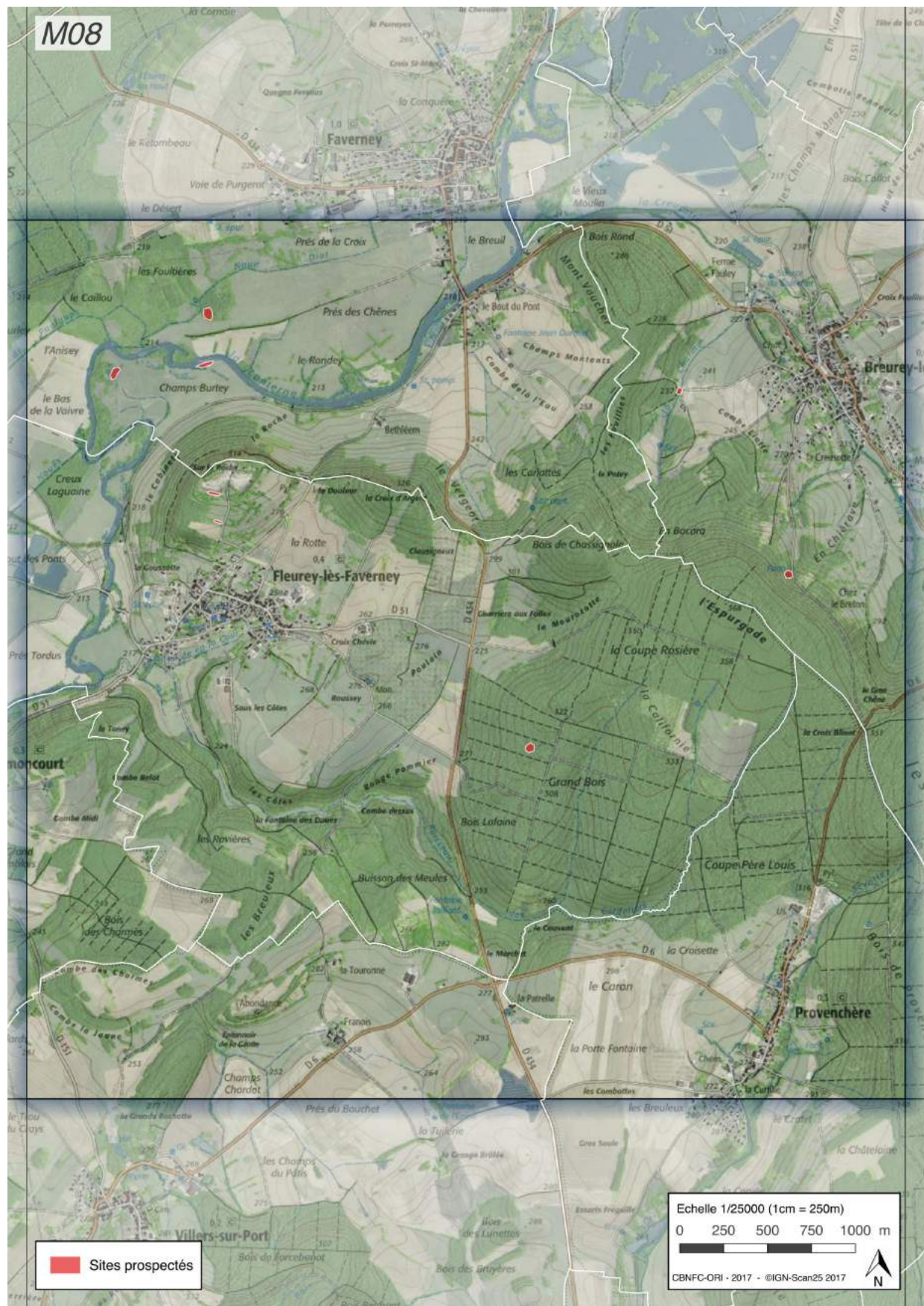
Figure n°5 - Maille M08.