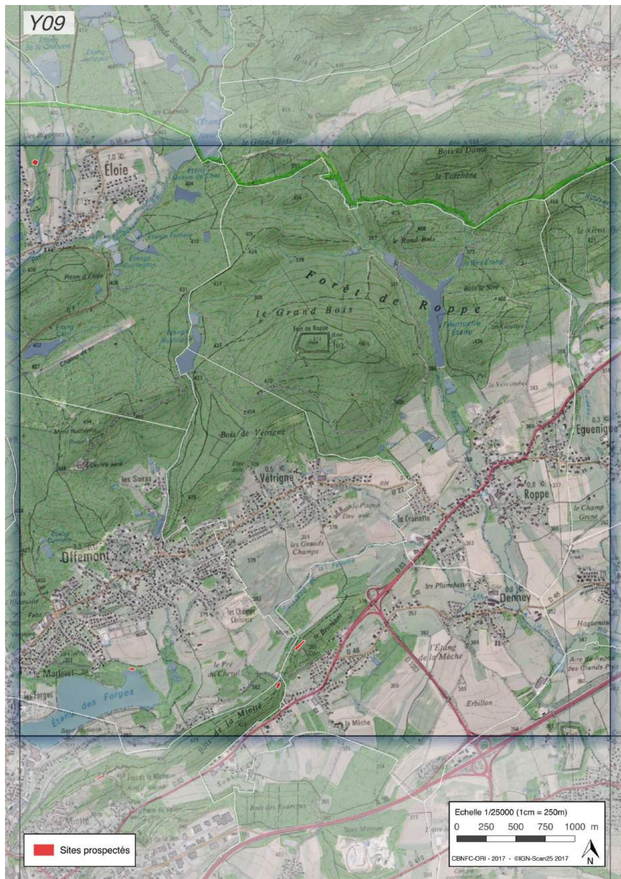
Figure n°9 - Maille Y09.