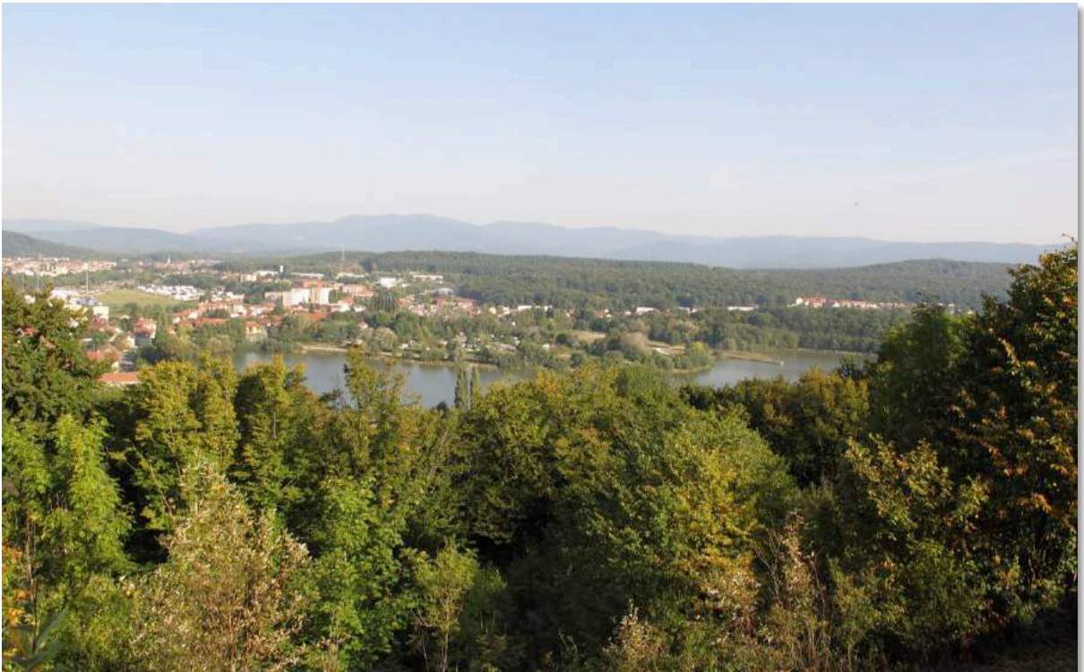
Figure n°8 - Vue sur l'étang des Forges et la forêt de Roppe depuis le fort de la Miotte à Belfort.