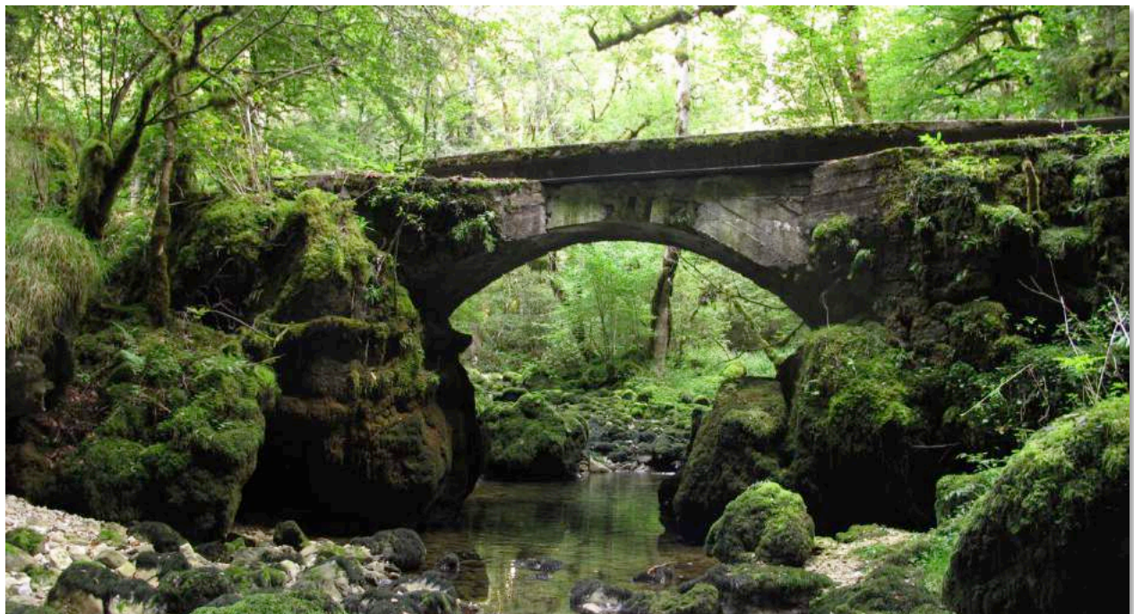
Figure n°6 - Le Dessoubre proche de sa source, au fond du cirque de Consolation (J. Ryelandt).