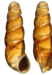
Aiguillette de Dupuy ( Platyla dupuyi ) (O. Gargominy)