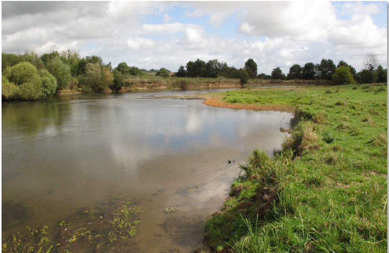
Figure n°4 - La Lanterne aux Champs Burtey, sur la commune de Faverney (J. Ryelandt).

Parmi les 32 espèces identifiées, aucune ne présente un intérêt patrimonial particulier.