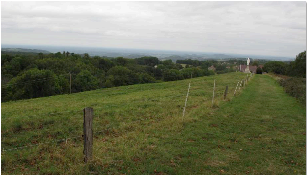
Figure n°2 - Vue sur la vallée de la Sorne depuis Saint-Maur (J. Ryelandt).