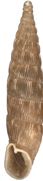
Clausilie dentée ( Laciniaria p. plicata ) (O. Gargominy)