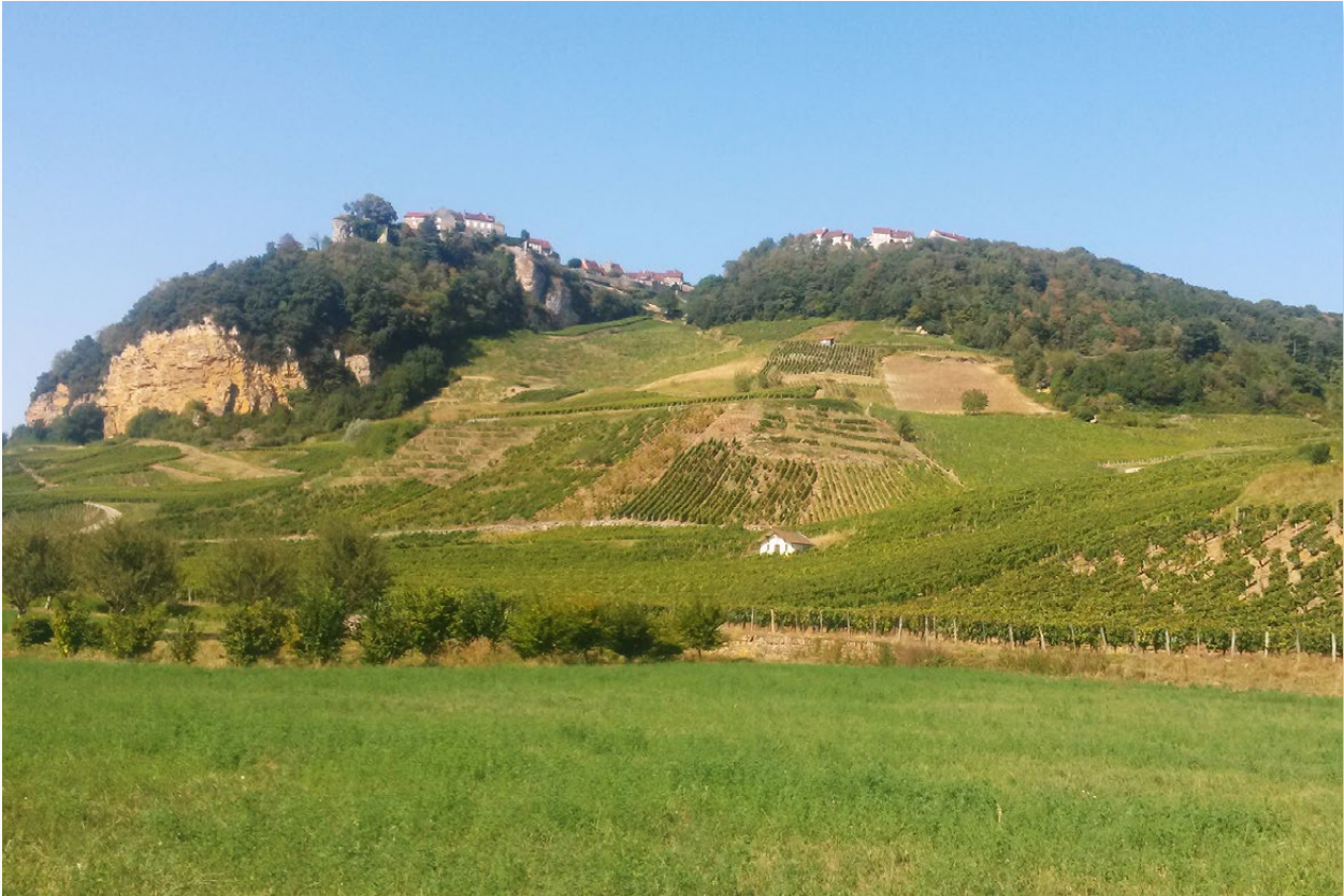
Figure n° 4 : vue de Château-Chalon depuis la vallée de la Seille (J. Ryelandt).