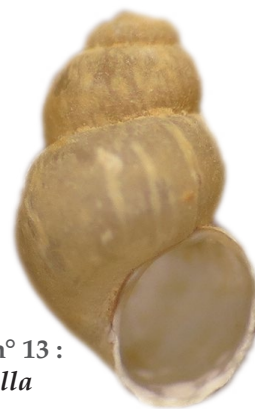
Figure n° 13 : Bythinella vesontiana (J. Ryelandt).

Une autre espèce remarquable est présente sur la commune de Fondremand, au niveau de la source de la Romaine. Il s'agit de la bythinelle de Quenoche ( Bythinella vesontiana ), mollusque protégé au niveau national (voir description maille X15 ci-dessus). D'autres stations de cette espèce ont été découvertes dans les sources des collines aux alentours : à la Fontaine Ferrée (Fondremand), le Droit du Mont (Hyet), la Source des Ermites (Rioz) et la Combe du Charmoy (Sorans-lès-Breurey).