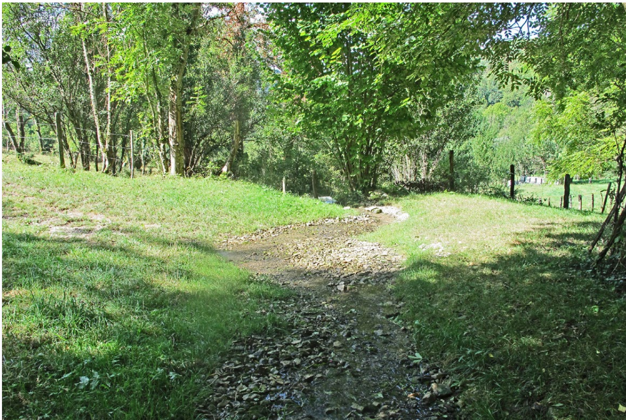
Figure n° 1 : site 1 à Ecurcey (J. Ryelandt).