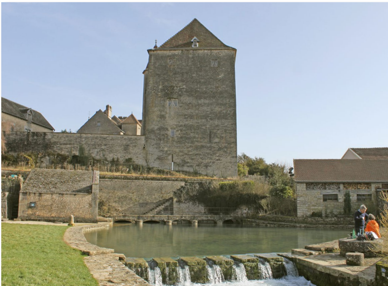
Figure n° 11 : château de Fondremand et source de la Romaine (J. Ryelandt).