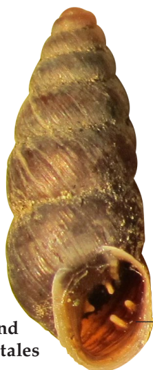
Figure n° 12 : Chondrina cf. avenacea de Fondremand à 2 dents palatales (J. Ryelandt).

Les mollusques sont des espèces peu mobiles et assez exigeantes, ce qui donne lieu dans ce groupe faunistique à beaucoup de cas d'endémisme avec des espèces parfois très localisées, rare et bien souvent menacées. En effet, les milieux les plus riches d'un point de vue malacologique sont les secteurs ayant subi peu de modifications dans le temps. Il s'agit en général d'endroits ayant échappés à l'exploitation humaine (anciennes forêts, certaines tourbières, falaises et corniches des vallées alluviales, etc.) ou encore de milieux préservés des activités car patrimoniaux (anciens bâtis, châteaux en ruine...).