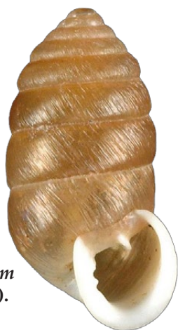
Figure n° 2 : Orcula d. dolium (O. Gargominy).

La maille X15, située dans le département du Doubs, à environ 10 km au sud de Montbéliard, présente un faciès au dénivelé important variant de 340 m d'altitude au niveau du Doubs à 590 m au cœur du bourg d'Ecurcey. Elle se compose à parts égales de deux entités paysagères : d'une part des milieux ouverts, représentés par des prairies et cultures, concentrés au centre et à l'est de la maille, et d'autre part des bois de pentes situés au nord de la maille ainsi que dans les vallons du sud et de l'ouest.