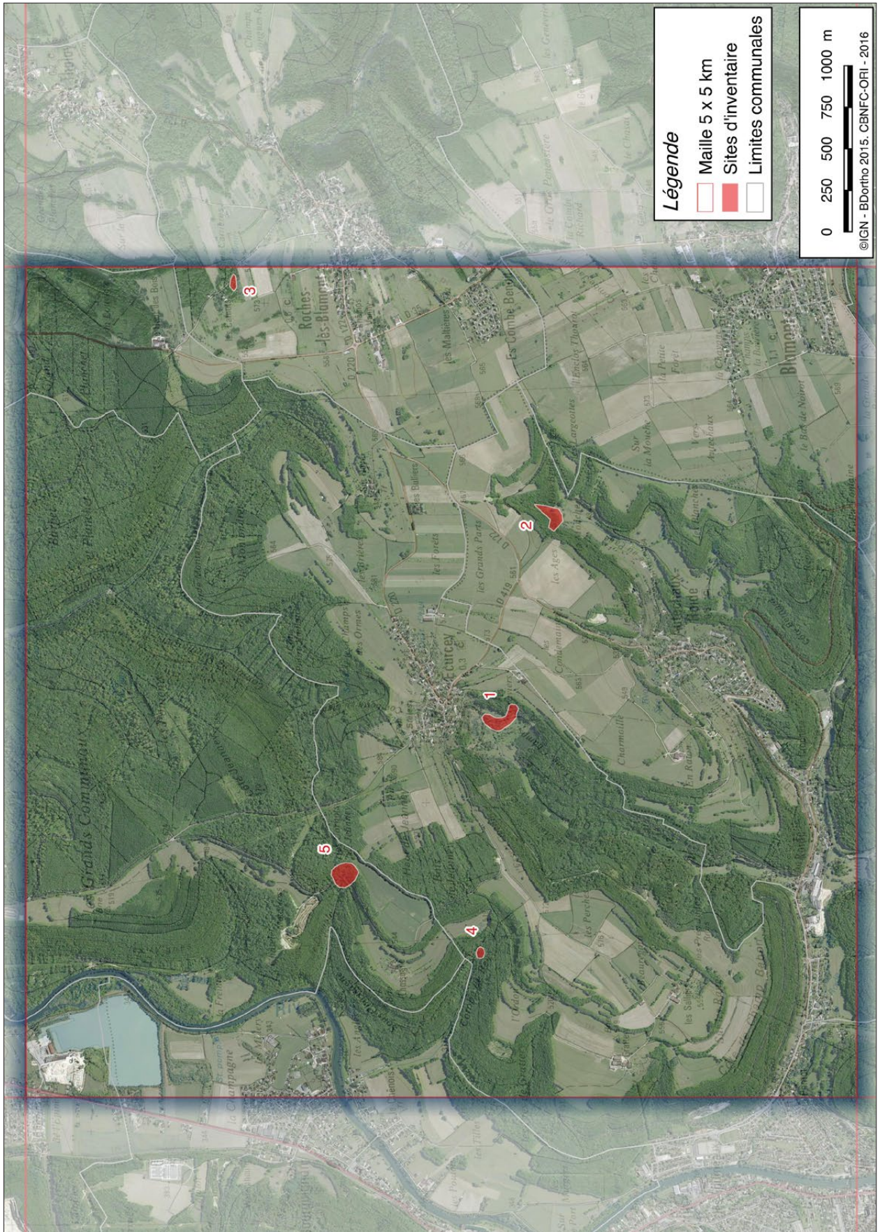
Figure n° 3 : maille X15.