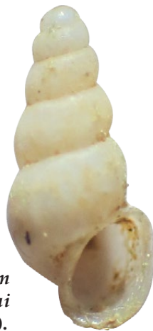
Figure n° 5 : Bythiospeum cf. racovitzai (J. Ryelandt).