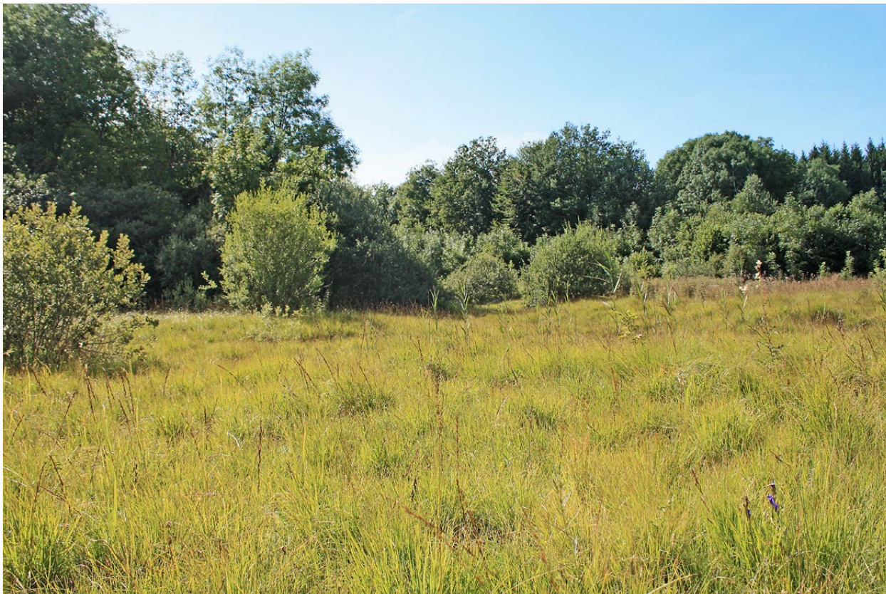
Figure n° 7 : les Marais, Charcier (A. Franzoni).