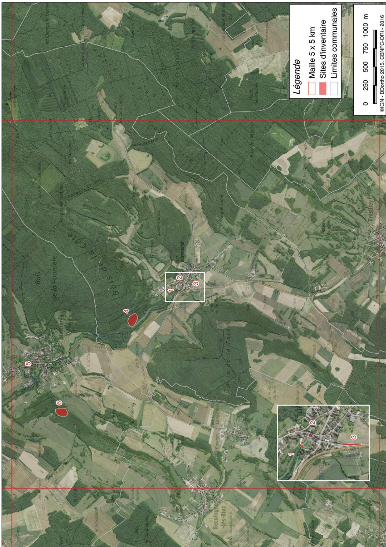
Figure n° 14 : maille L14.