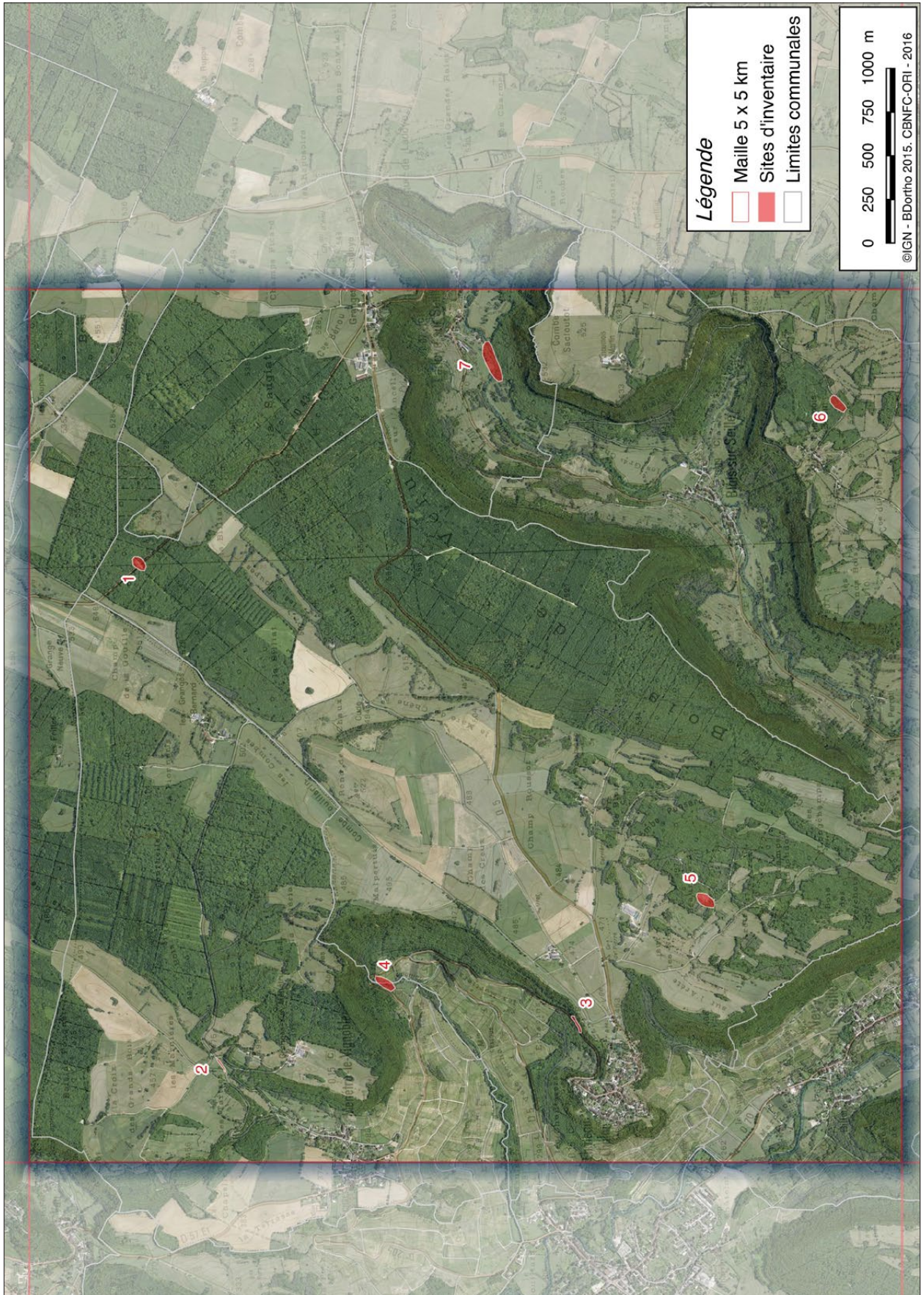
Figure n° 6 : maille G30.