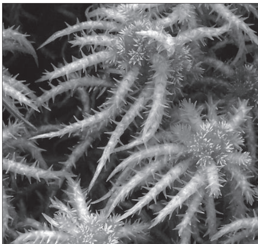
Sphagnum squarrosulum Crome

Zygodon viridissimus (Dicks.) Brid. Ronchamp, Monts de Vannes.