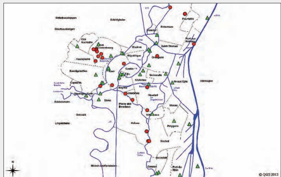
Figure 2 : localisation des nouvelles observations 2010 (triangle vert) et 2011 (rond rouge)