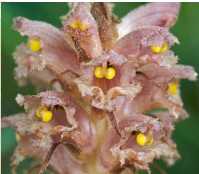
Hampe florale d' Orobanche bartlingii - Cliché : G. BAILLY

Dans certaines localités, la plante fréquente également les bermes routières, au pied de talus couverts d'éboulis embroussaillés.