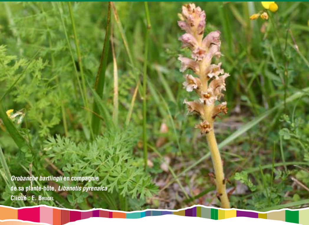
Orobanche bartlingii en compagnie de sa plante-hôte, Libanotis pyrenaica