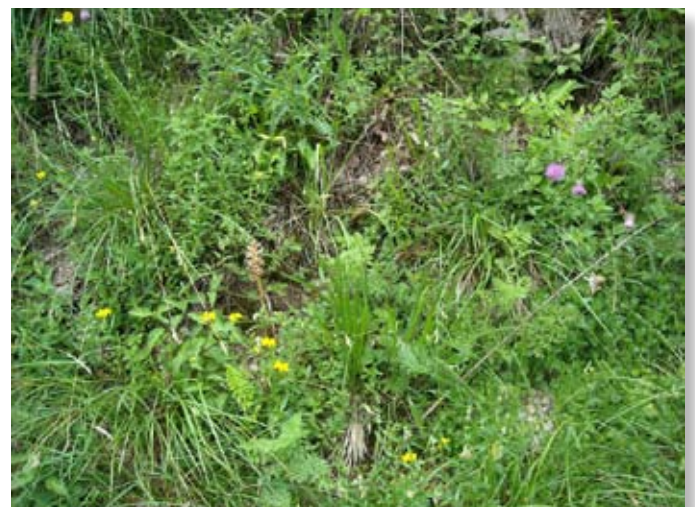
Pelouse sur éboulis fins abritant Orobanche bartlingii , à Cour-Saint-Maurice (25)