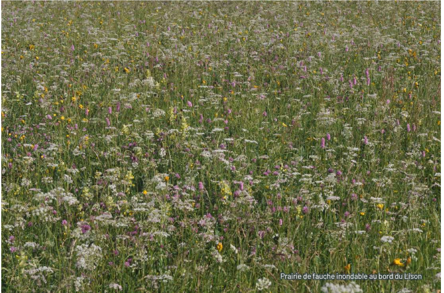
Prairie de fauche inondable au bord du Lison