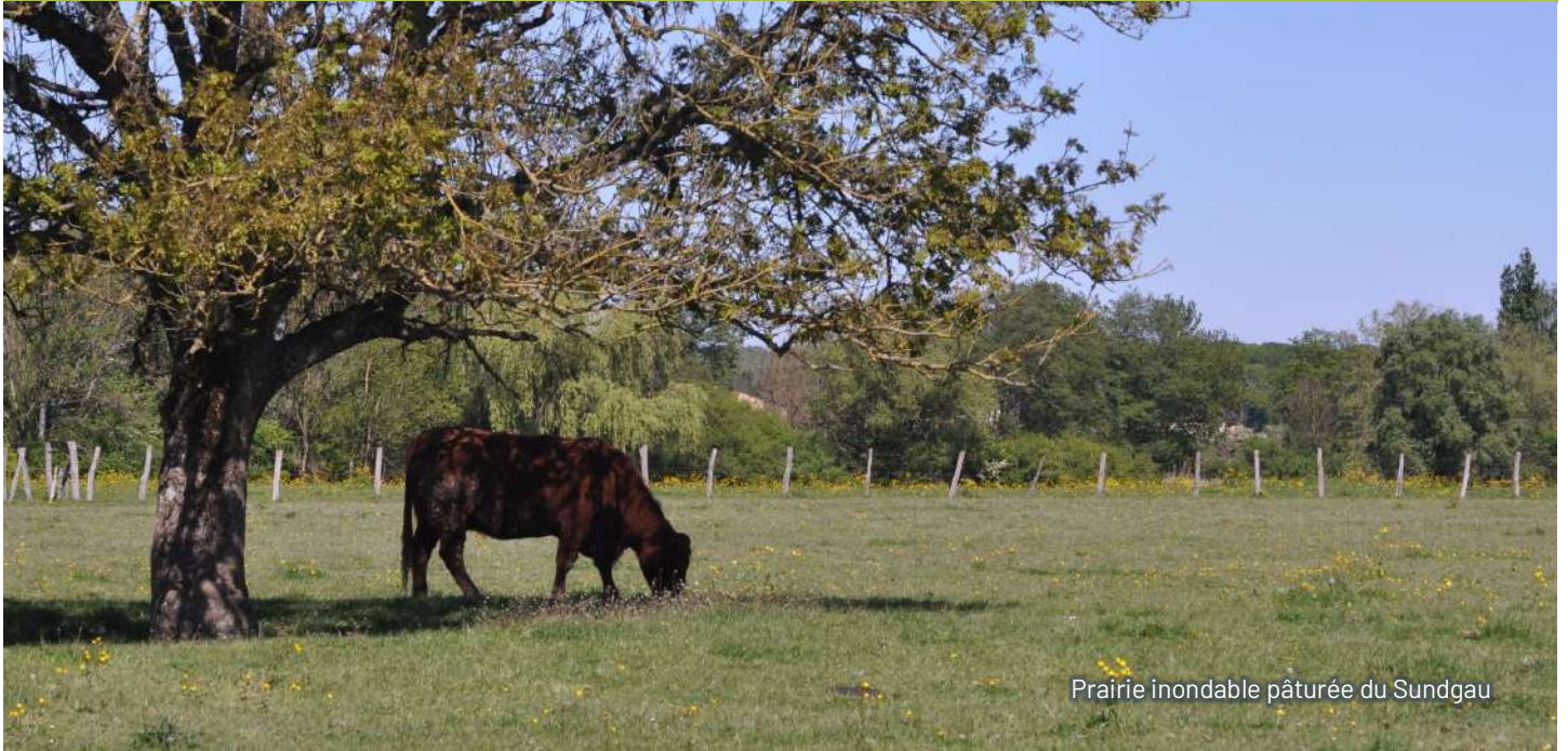
Prairie inondable pâturée du Sundgau