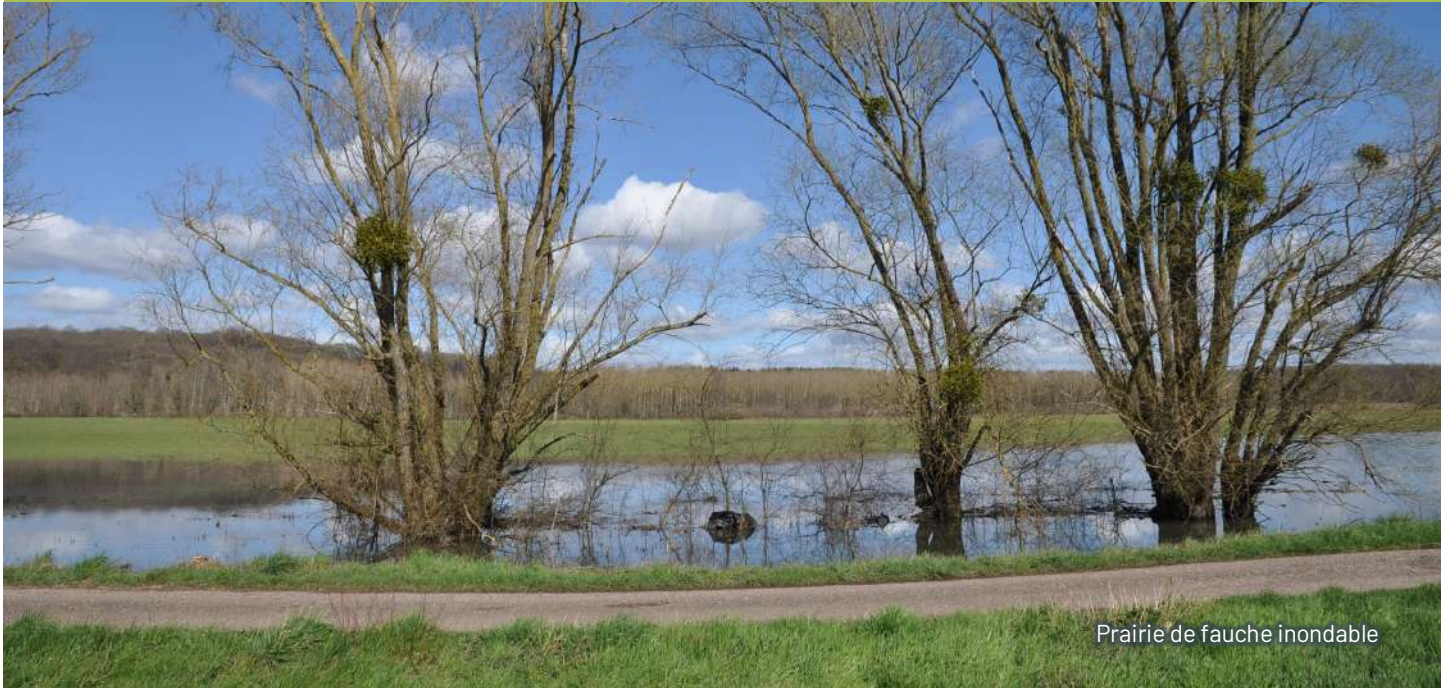
Prairie de fauche inondable