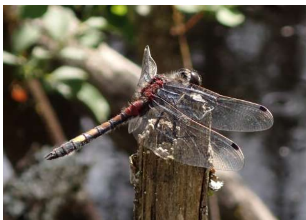
FIGURE N°3 - Leucorrhinia pectoralis a bénéficié favorablement des travaux de restauration menés dans le cadre du programme Life tourbières du Jura.

Au cours de l'année 2022, les investigations menées par le CBNFC-ORI, dans le cadre de diverses études, ainsi que par d'autres structures régionales (Conservatoire d'espaces naturels de Franche-Comté...) et le concours de bénévoles ou d'observateurs indépendants, ont amené à découvrir de nouvelles stations d'espèces menacées inscrites dans le PRA (tableau I).