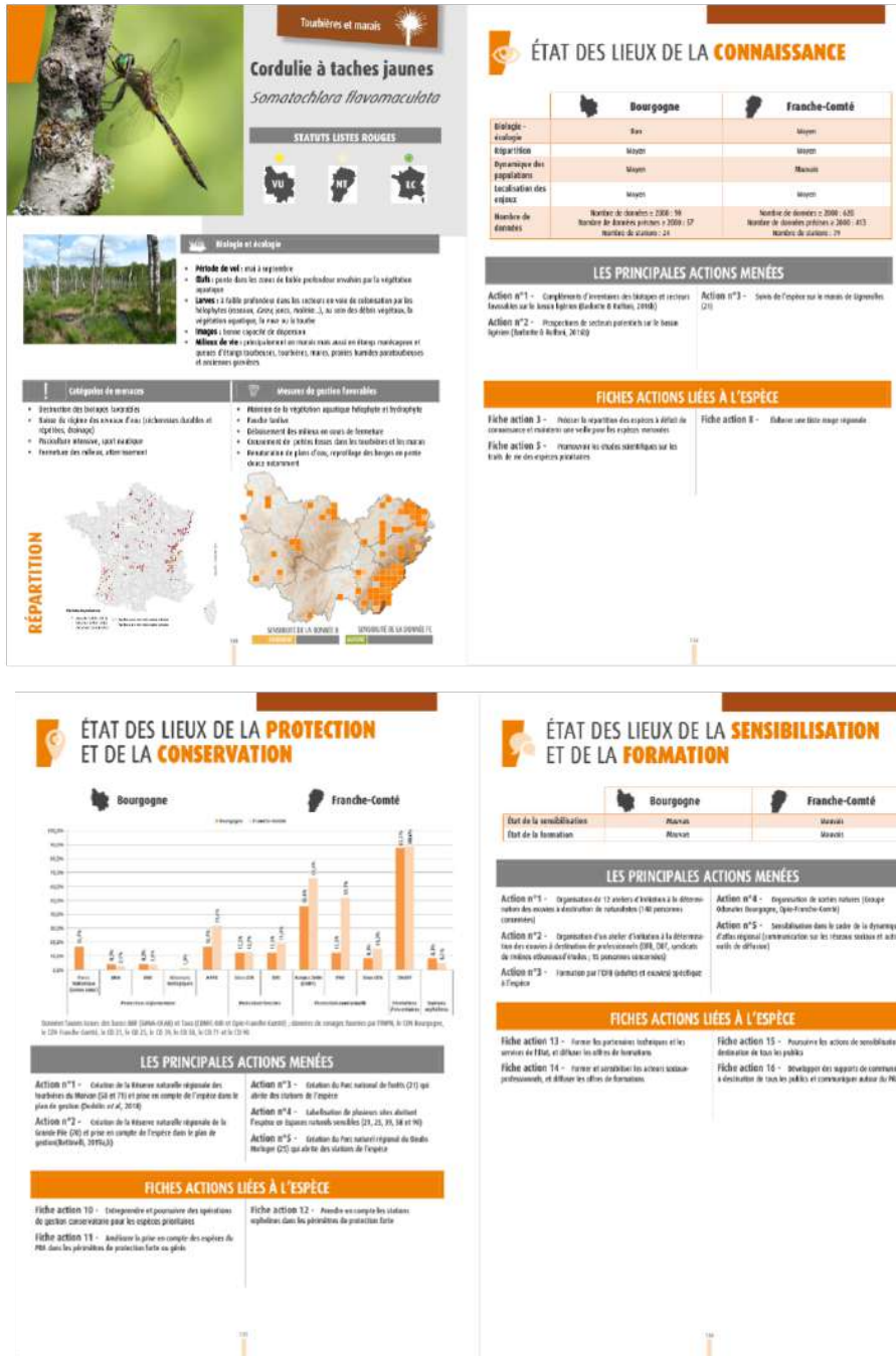
FIGURE N°2 - Un exemple de fiche espèce : la cordulie à taches jaunes.