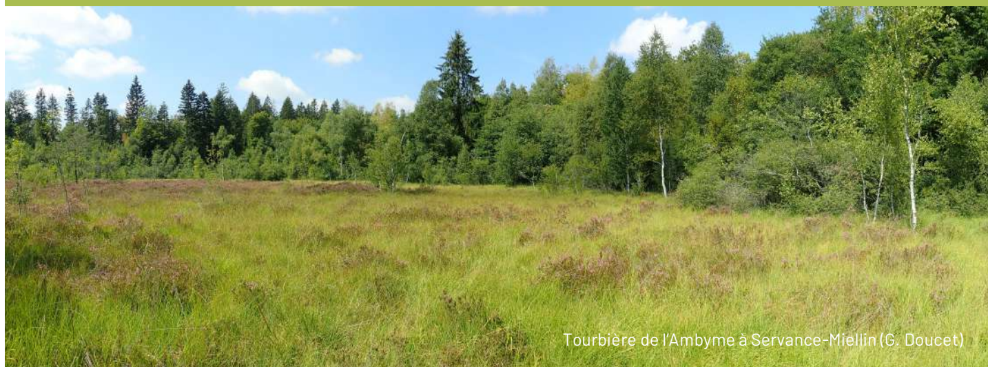
Tourbière de l'Ambyrne à Servance-Miellin (G. Doucet)