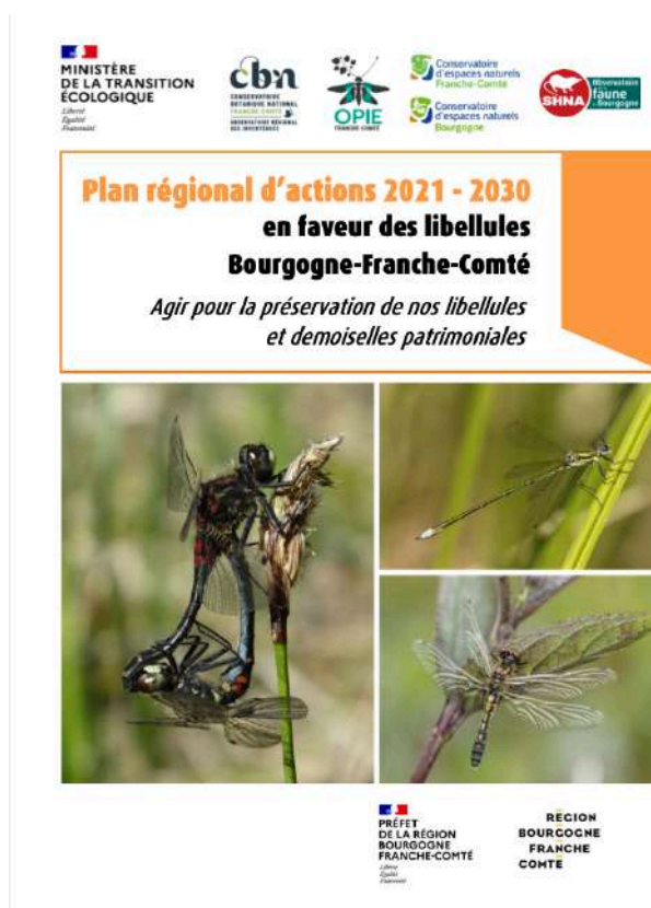
FIGURE N°1 - Couverture du PRA libellules.

devrait voir le jour prochainement. Il restera toutefois encore l'exercice du passage en CSRPN avant une validation complète du document.