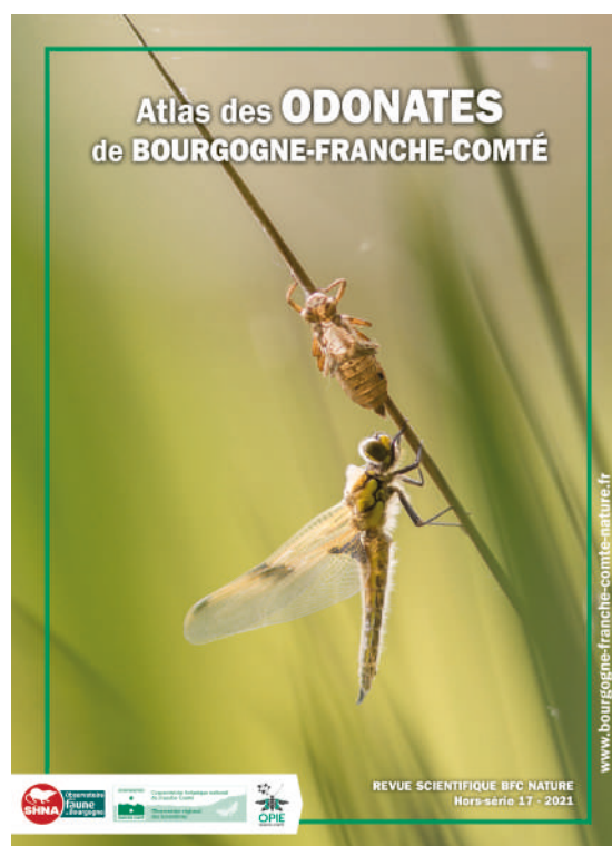
FIGURE N°11 - Couverture de l'atlas.

Débuté en 2010, l'atlas des odonates de Bourgogne-Franche-Comté est paru en mai 2022. L'ouvrage est le fruit d'un travail collaboratif entre les entomologistes du CBNFC-ORI, de l'Opie-Franche-Comté et de la SHNA-OFAB. Il rassemble plus de 100 000 données collectées grâce au travail de terrain d'un millier d'observateurs. Des monographies richement illustrées sont proposées pour chacune des 75 espèces présentes dans la région : répartition régionale, écologie, biologie, statuts et menaces sont ainsi abordés. Une vingtaine de chapitres introductifs complètent le tout, proposant ainsi au lecteur un tour d'horizon complet pour découvrir le territoire, les phases de vie, l'histoire et les enjeux environnementaux qui touchent ce groupe d'insectes en Bourgogne-Franche-Comté.