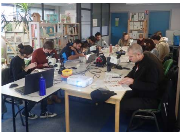
FIGURE N°12 - Formation « initiation à la détermination des exuvies d'odonates » (R. Itrac-Bruneau).

Une journée de formation dédiée à l'identification des exuvies de libellules a été organisée dans les locaux de la Maison de l'environnement de Bourgogne-Franche-Comté à Besançon (25) le 03 décembre 2022. Cette formation a été dispensée par les bénévoles de l'Opie-Franche-Comté, en partenariat avec le CBNFC-ORI qui s'est occupé de l'encadrement. La journée a réuni 13 participants. Il s'agissait en majorité d'étudiants (2 Master, 2 BTS GPN) et futurs étudiants (2 profils en reconversion) mais aussi de personnes travaillant dans des postes naturalistes (1 chargée de mission Natura 2000 et 1 gestionnaire d'ENS), 2 services civiques ainsi que 3 profils autres (dont 1 formateur en lycée agricole).