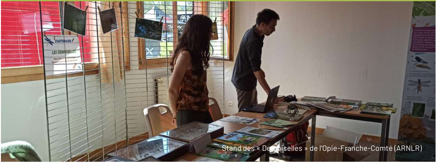
Stand des « Demoiselles » de l'Opie-Franche-Comté (ARNLR)