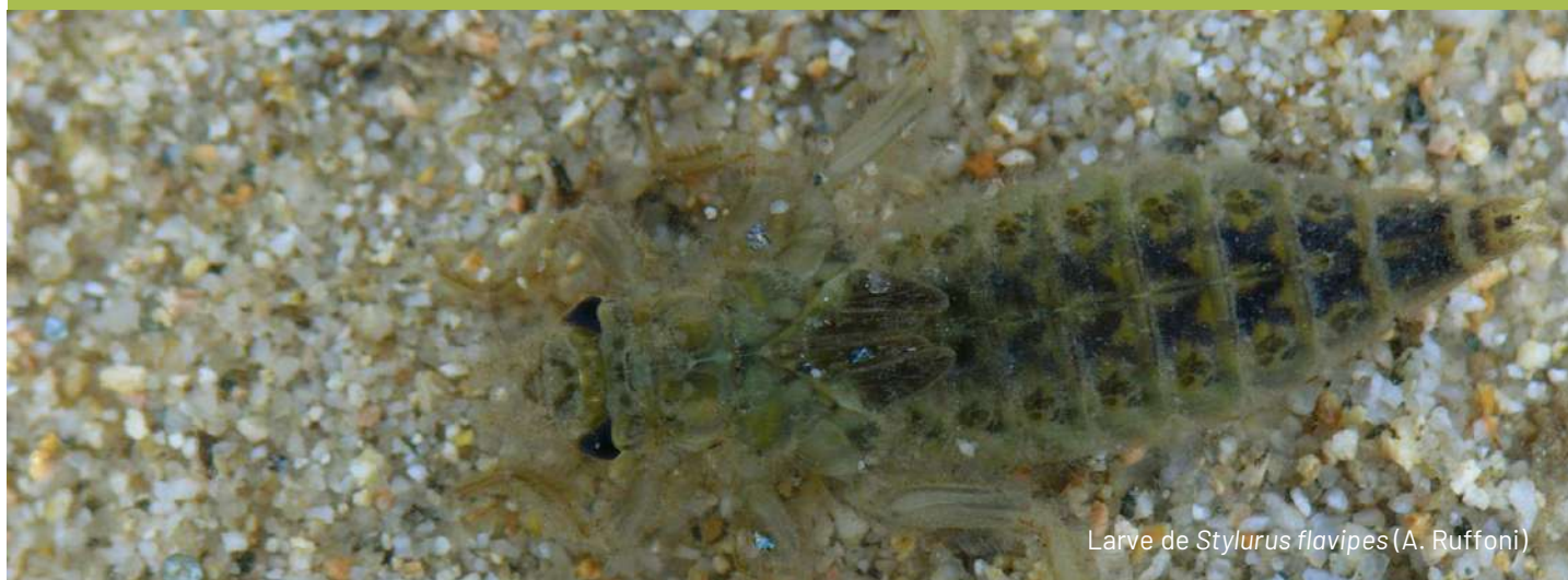
Larve de Stylurus flavipes (A. Ruffoni)