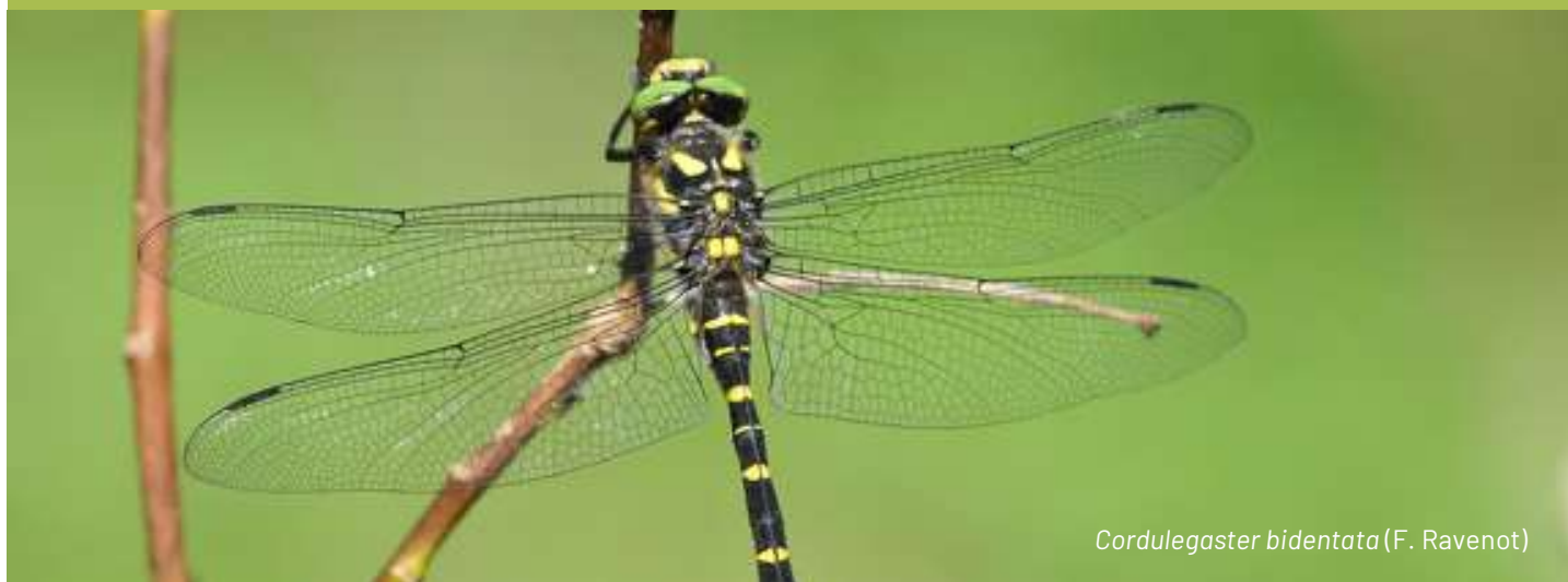
Cordulegaster bidentata (F. Ravenot)