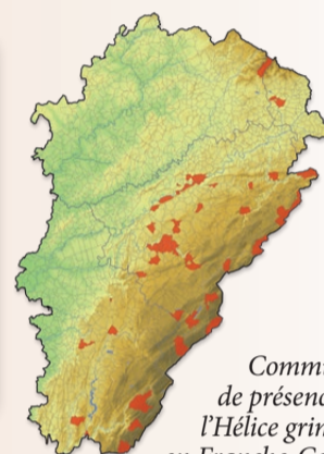
Communes de présence de l'Hélice grimace en Franche-Comté