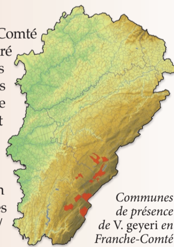
Communes de présence de V. geyeri en Franche-Comté